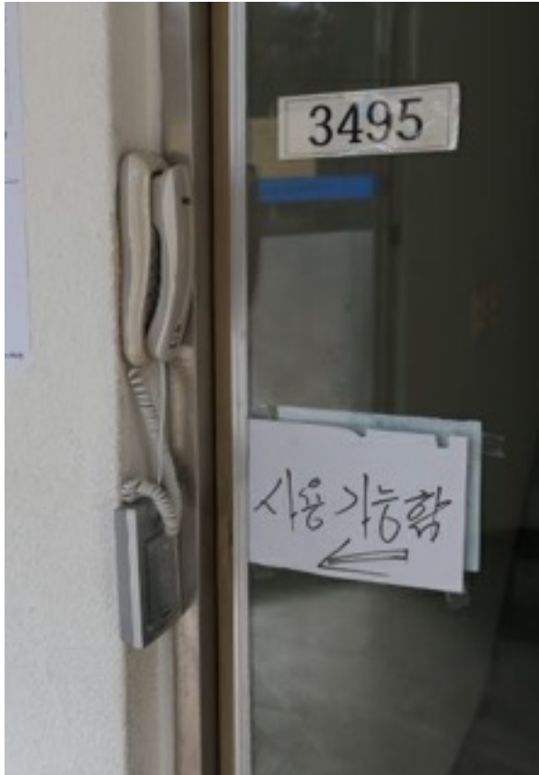
< 기존 출입시스템 >