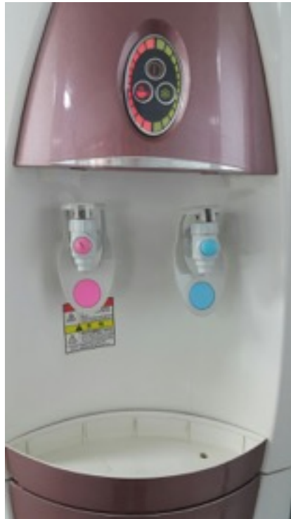
< 기존 정수기 >