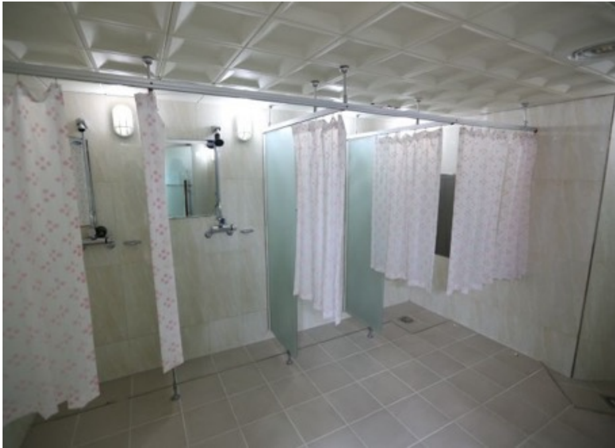
< 기존 샤워실 >